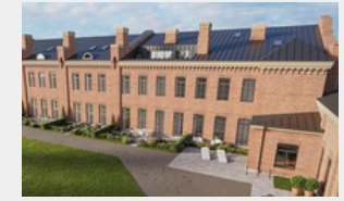
Dunte | Kristiine, Tallina

Kristiine City – Kindrali Houses, Marsi 6, Ratsuri Houses - dzīvojamais kvartāls