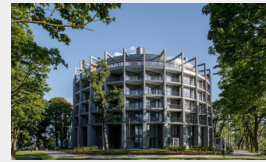
River Breeze Residence, Rīga