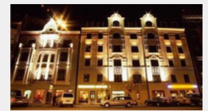
Pulkveža Brieža iela 11/13, Rīga

Palasta iela 9 – dzīvojamā un komercielpu ēka