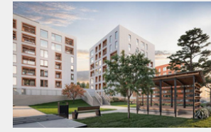
Kindrali mājas | Kristiine, Tallina