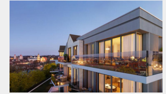
Vilos | Viļņa

Šaltinių Namai| Attico – prestižs dzīvojamais rajons Viļņā